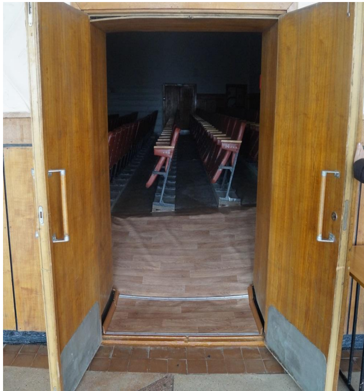
Φοτο Νο 11