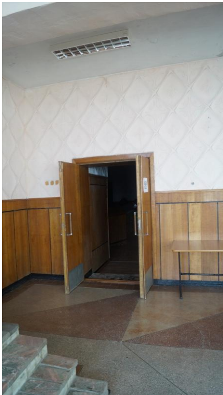
Φοτο Νο 10