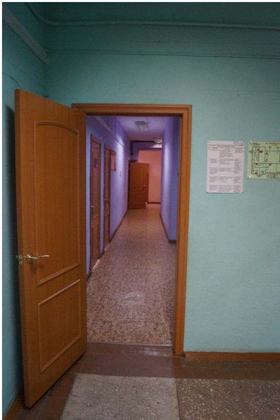
Φoto № 8