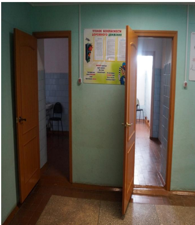
Фото № 6