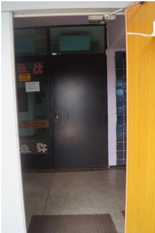
Фото № 4