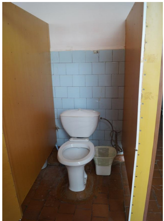
Фото № 7