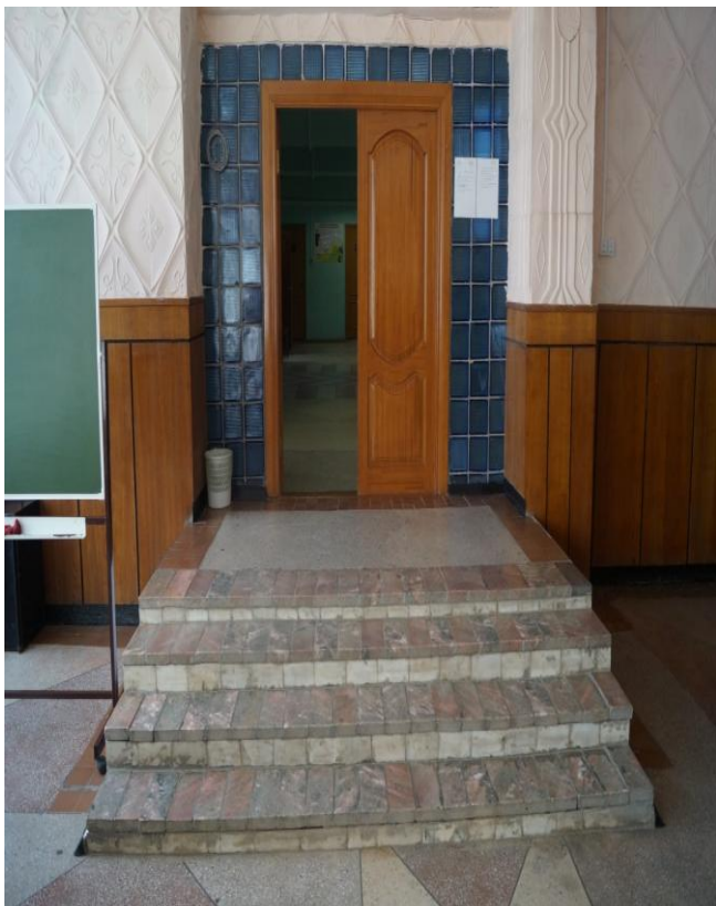
Φοτο Νο 12