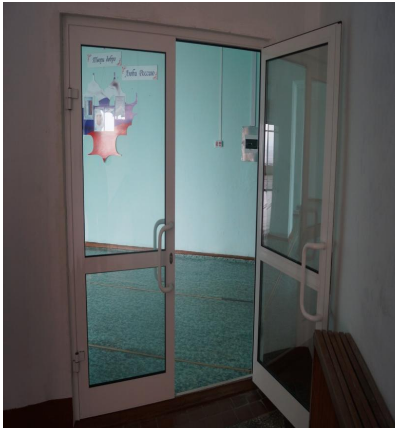
Φοτο Νο 15