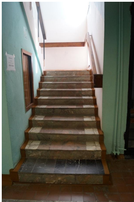
Φοτο Νο 13