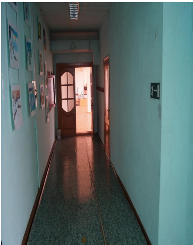
Φοτο Νο 16