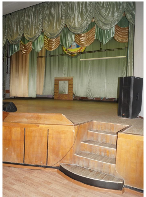
Φοτο Νο 17