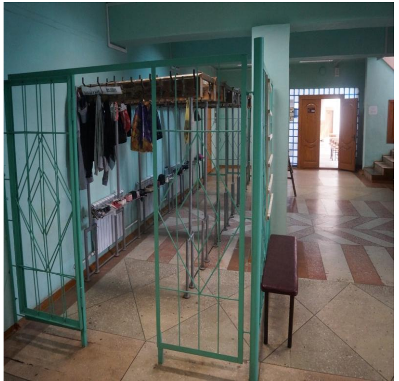
Фото № 5