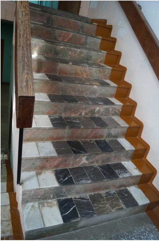
Φοτο № 14